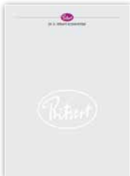
Geschäfts-Briefbogen mit Firmenlogo als Wasserzeichen.

Und das Beste: Ihre bestehenden Formular-Masken bleiben unverändert.