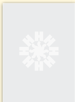
...hell in der Aufsicht