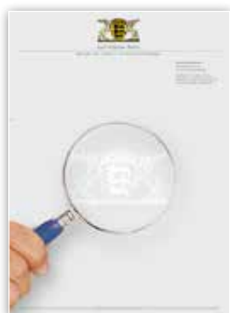
Briefbogen mit Landeswappen als Wasserzeichen.

Und dazu genügt ein moderner Farbkopierer.